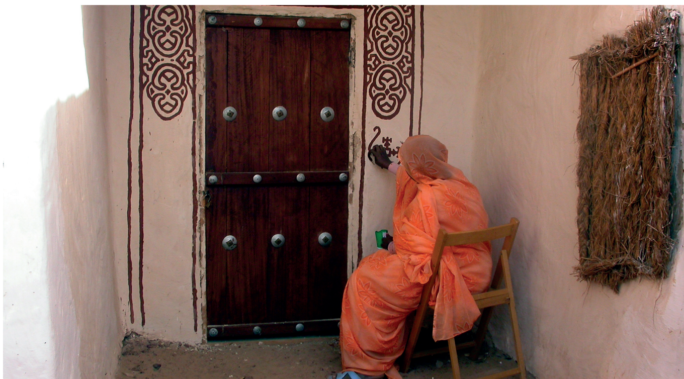
Participación ciudadana en la recuperación del centro histórico de Wallata (Mauritania)

La consideración de la diversidad cultural y la identidad de las comunidades, la mejora de la calidad de vida de los individuos, la generación de actividad económica, de inversiones y empleo en los diversos sectores del patrimonio, una mejora de la gobernabilidad en las acciones públicas para contribuir al fortalecimiento de los distintos estamentos de la administración, la cooperación interinstitucional y con el sector privado, así como la participación y movilización de la sociedad civil, son las consideraciones que el programa de patrimonio de la AECID ha tenido y tiene presentes para llevar a cabo sus intervenciones en los más de 25 años que tiene de existencia.