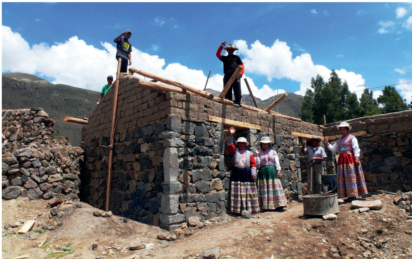
Programa de vivienda rural y desarrollo social en el Valle del Colca (Perú)

El Programa Patrimonio para el Desarrollo (P>D) se concibe como un instrumento de la Agencia Española de Cooperación Internacional para el Desarrollo (AECID) en su contribución al desarrollo sostenible y la lucha contra la pobreza, a través de la utilización del patrimonio cultural como generador de progreso de las comunidades depositarias del mismo. Para ello se apoyan acciones de puesta en valor y gestión sostenible del patrimonio cultural, orientadas tanto a mejora de la habitabilidad, el fortalecimiento institucional, las capacidades de gestión y la generación de ingresos, así como a la protección de la identidad, el legado cultural y la memoria colectiva.