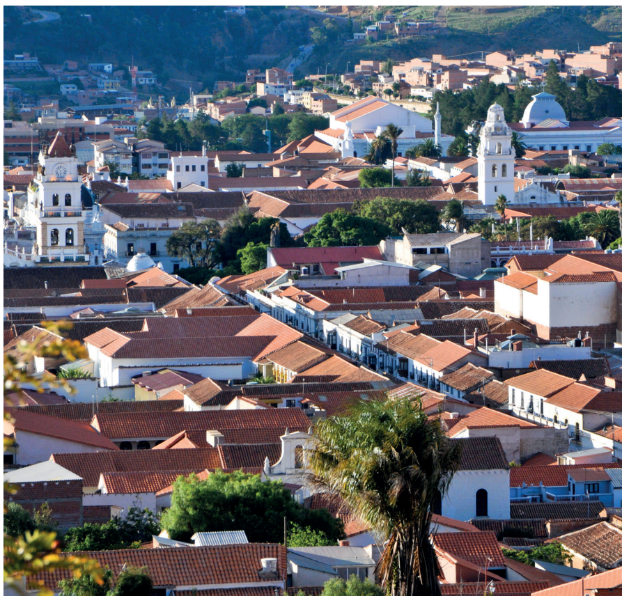
Apoyo al Plan de Rehabilitación de las Áreas Históricas de Sucre (Bolivia).

Estas intervenciones se desarrollan con una participación directa de la ciudadanía y las comunidades locales en los programas de conservación del patrimonio y de recuperación de la memoria colectiva, identificando y replicando buenas prácticas para las políticas culturales inclusivas. Tal es el caso del proyecto iniciado con las bibliotecas de manuscritos de Chinguetti (Mauritania), en el que el Programa ha actuado como