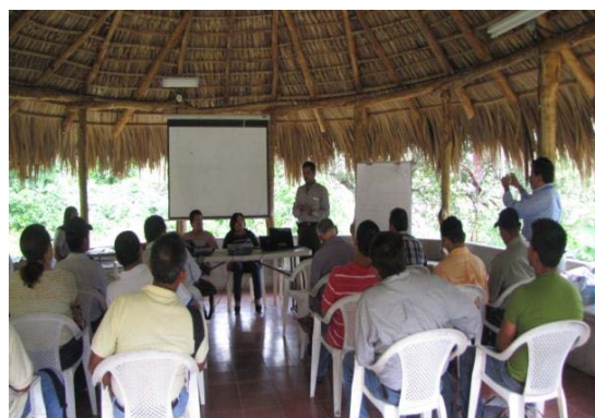
Fotografía 4: Taller de Operación y Mantenimiento de sistemas rurales de abastecimiento de agua potable