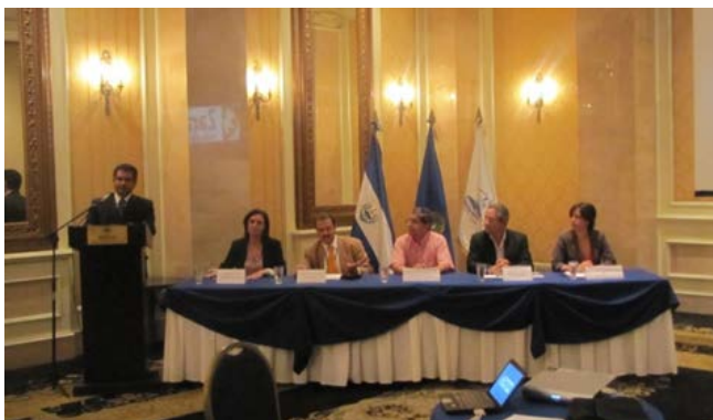
Fotografía 1: Presentación en San Salvador de la asesoría on-line