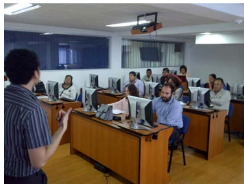
Fotografía 2: Presentación en Panamá de la asesoría on-line